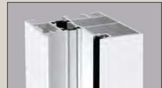
Thermisch getrennte Alu-Zarge A2