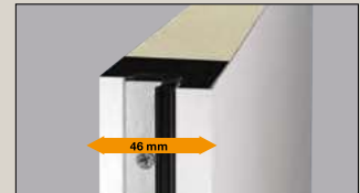
Thermisch getrenntes Türblatt